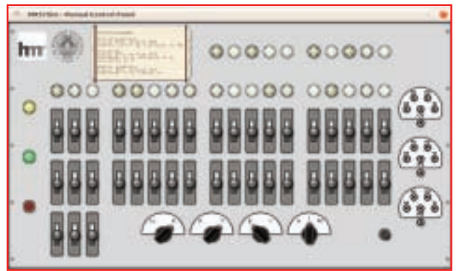
Il simulatore della Macchina Ridotta (2013, su progetto hardware del 1957)

Le ricostruzioni oggetto della ricerca di HMR sono parte integrante della missione di conservazione e restituzione del Museo. Oltre all'uso di simulatori e repliche nei laboratori didattici proposti soprattutto alle scuole, la ricostruzione porta alla massima conoscenza possibile della macchina e permette di verificare molti aspetti della sua Storia. Nel caso della MR le sorprese non sono mancate. Si è trovato un calcolatore scientificamente e tecnologicamente molto più interessante (nel 1957) di quanto non fosse (nel 1961) il secondo calcolatore pisano, la ben più celebrata CEP. Si è anche scoperto che il progetto di ricerca che realizzò le due macchine non fu proprio un'epica coincidenza di scienziati illustri (Fermi), politici illuminati (gli Enti locali) e industriali intraprendenti (Olivetti). Fu invece una molto più normale, vera (e istruttiva) storia di finanziamenti interrotti proprio all'indomani di un grande risultato (la MR). Una storia restituita al pubblico grazie alla curiosità un po' hacker di scavare a fondo.