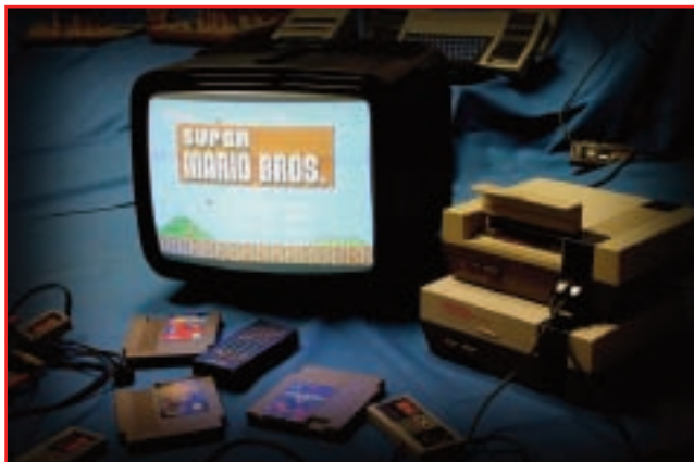
Il NES (1983), il Brionvega Spot (1978) e Super Mario Bros (1985): retrocomputing, ovvero fare Storia dell'Informatica vincendo facile

Gli eventi e le mostre di retrocomputing sono interessanti e divertenti, ma raccontano una storia recente e mostrano un'informatica matura come disciplina e come tecnologia, già diventata prodotto di massa. Un contesto in cui allo scienziato pioniere è ormai subentrato l'industriale. Non è un caso che molti considerino “geni dell'informatica” personaggi che invece sono imprenditori di successo. Molto è colpa della natura commerciale di tanta comunicazione, attenta più al mercato che alla diffusione della cultura scientifica. In ogni caso la Storia ne esce appiattita, concentrata