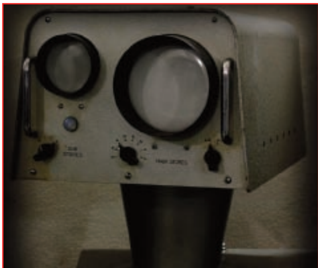
Interfacce aliene, il visore delle memorie del Ferranti Mk1* (1952) trapiantato sull'Olivetti 9104 CINAC (1966)

sugli Zii Paperone e privata di personaggi straordinari come gli Archimede Pitagorici.