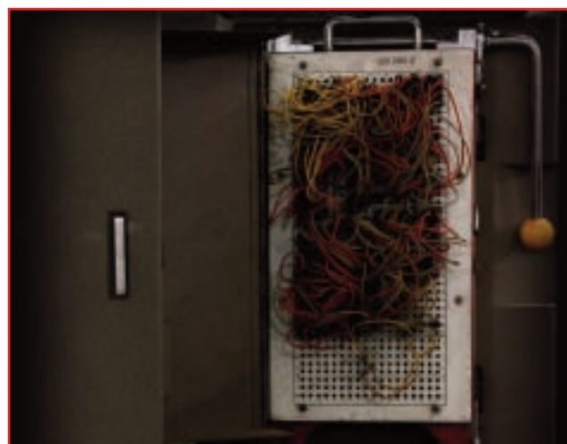
Software che è hardware, la plugboard per la programmazione del Bull Gamma3 (1953)

Nella ricostruzione della MR sono stati già ottenuti risulta-