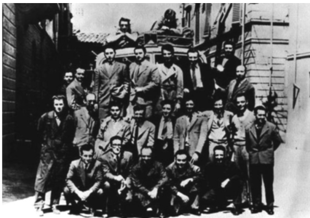
La Sezione Acceleratore dell'INFN in posa davanti al camion con le attrezzature di laboratorio, pronta a partire per Frascati (Pisa 1955)

Per gli storici è un fatto noto: la narrazione enfatica di eventi presentati come inesorabili marce verso il progresso si chiama whig history ed è spesso motivata dalla propaganda. Nel nostro caso è forse solo un'ingenua semplificazione, al più con una punta di italico orgoglio. Vediamo come si svolsero davvero i fatti.