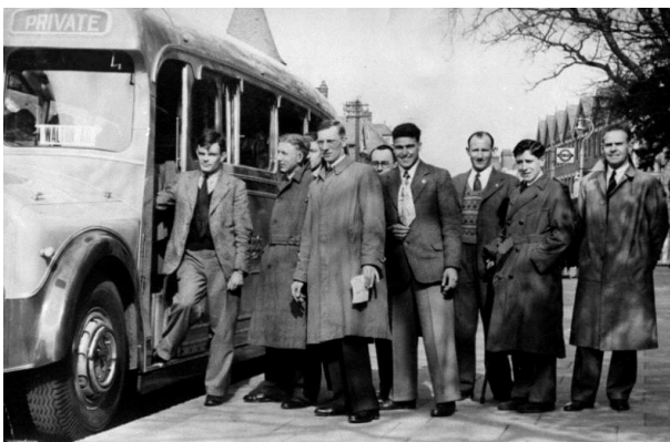
Turing in procinto di partire per una trasferta con il Walton Athletic Club