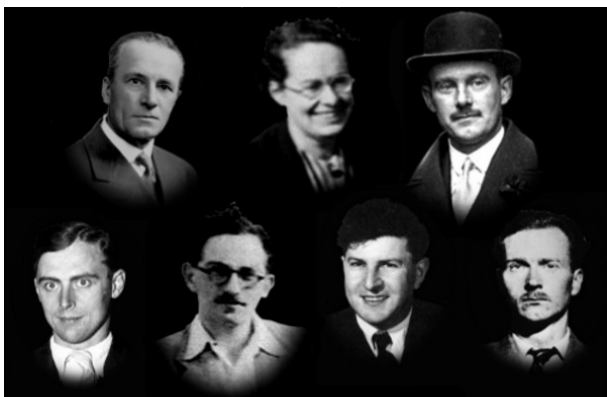
I personaggi protagonisti del film, le loro vere facce, più o meno al tempo dei fatti, da sinistra, sopra, Alistair Denniston, Joan Clarke e Stewart Menzies; sotto, Hugh Alexander, Jack Good, Peter Hilton e John Cairncross

Messaggio ricevuto (anzi decrittato potremmo dire) e contenti di cogliere la palla al balzo. In questo primo capitolo parleremo delle persone, i protagonisti della storia e i personaggi del film.