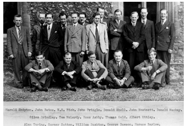
Una foto di gruppo del Ratio Dining Club, fra i membri ci sono molti nomi famosi

Tutte cose che si sposano male con il Turing del film, modellato seguendo l'ovvio stereotipo del nerd alla Sheldon Cooper, affascinante, ma un po' troppo strambo e scontroso.