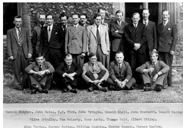
Una foto di gruppo del Ratio Dining Club, fra i membri ci sono molti nomi famosi

Tutte cose che si sposano male con il Turing del film, modellato seguendo l'ovvio stereotipo del nerd alla Sheldon Cooper, affascinante, ma un po' troppo strambo e scontroso.