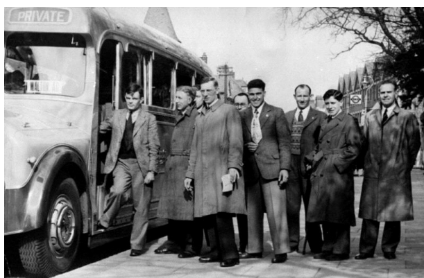
Turing in procinto di partire per una trasferta con il Walton Athletic Club